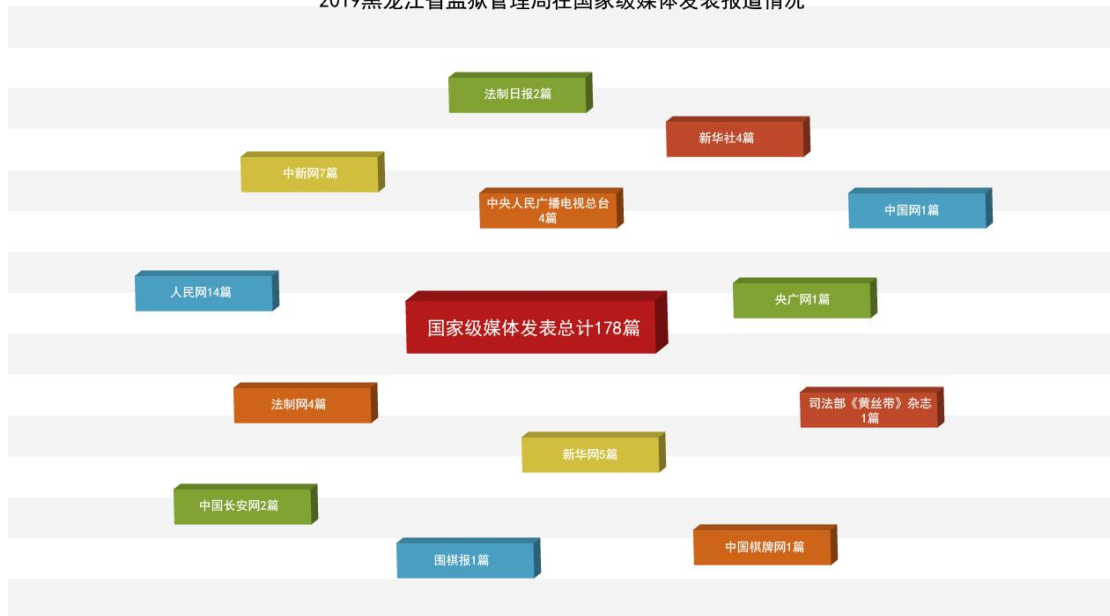
2019黑龙江省监狱管理局在国家级媒体发表报道情况

省级媒体：南方都市报1篇，澎湃网2篇，东北网29篇，平安龙江网8篇，黑龙江日报1篇，黑龙江晨报8篇，